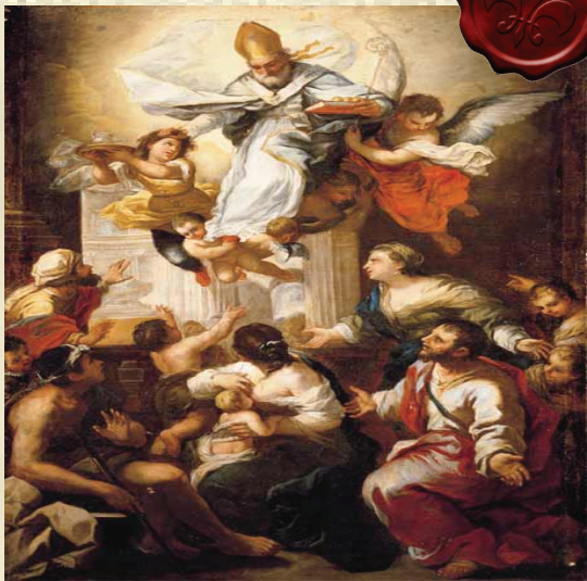
Arquitectura clasicista.

En la escultura se identifica sobre todo en las estatuas, en la ornamentación de plazas, jardines y fuentes. En España se manifiesta de manera muy acentuada en imágenes religiosas y estructura de iglesias.